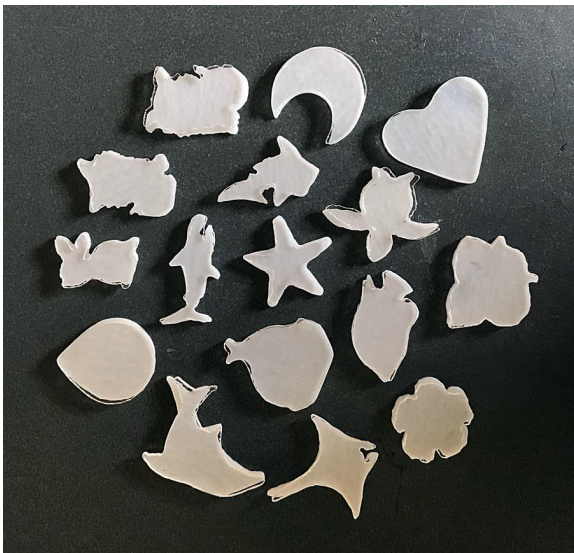
B) Design glass: experience fee ¥ 9,000